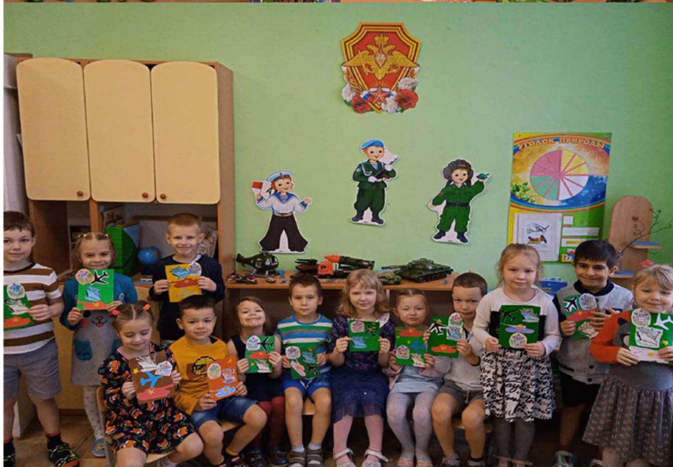
Группа № 10